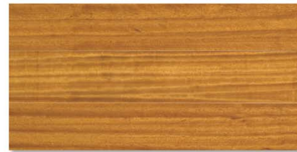
City | Iroko