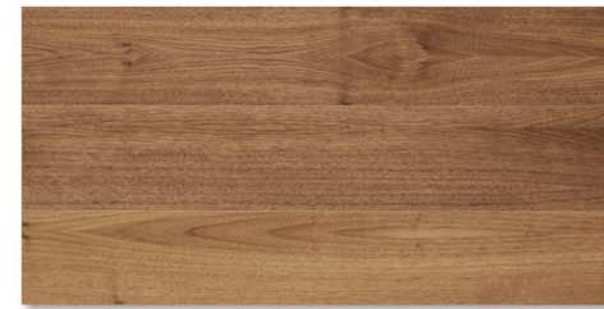
City | Noce Americano