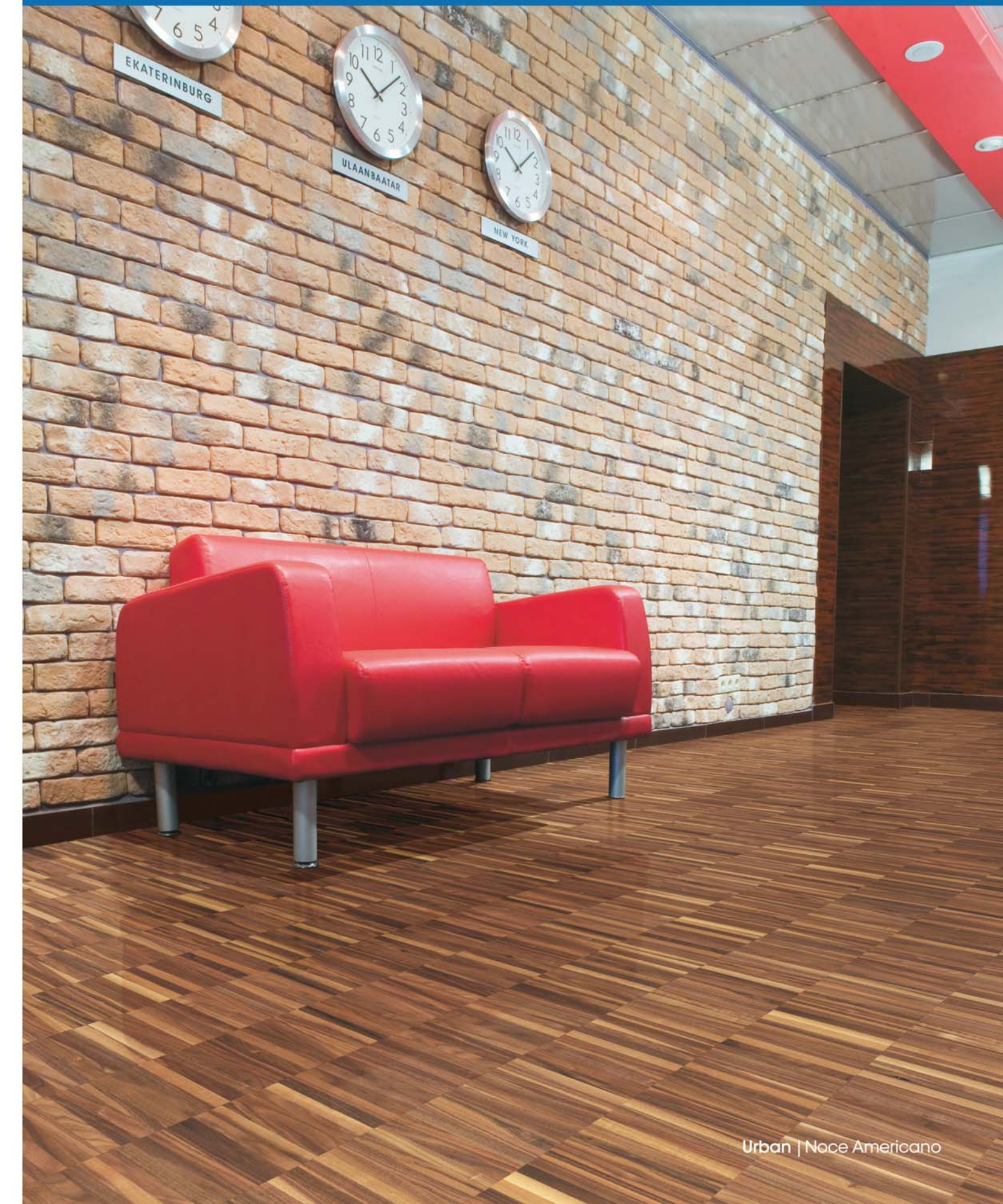
Urban | Noce Americano