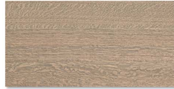
City | Rovere Grigio