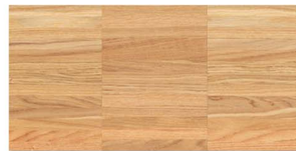
Urban | Rovere