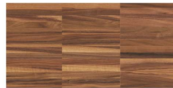
Urban | Noce Americano