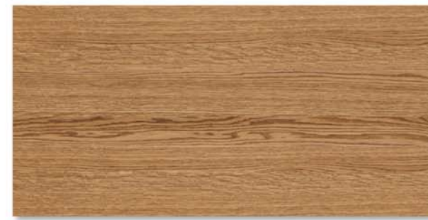
City | Rovere Naturale