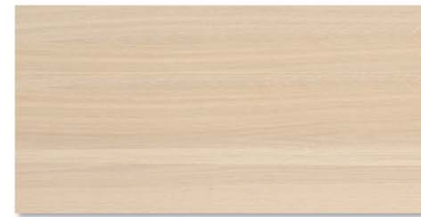
City | Rovere Bianco