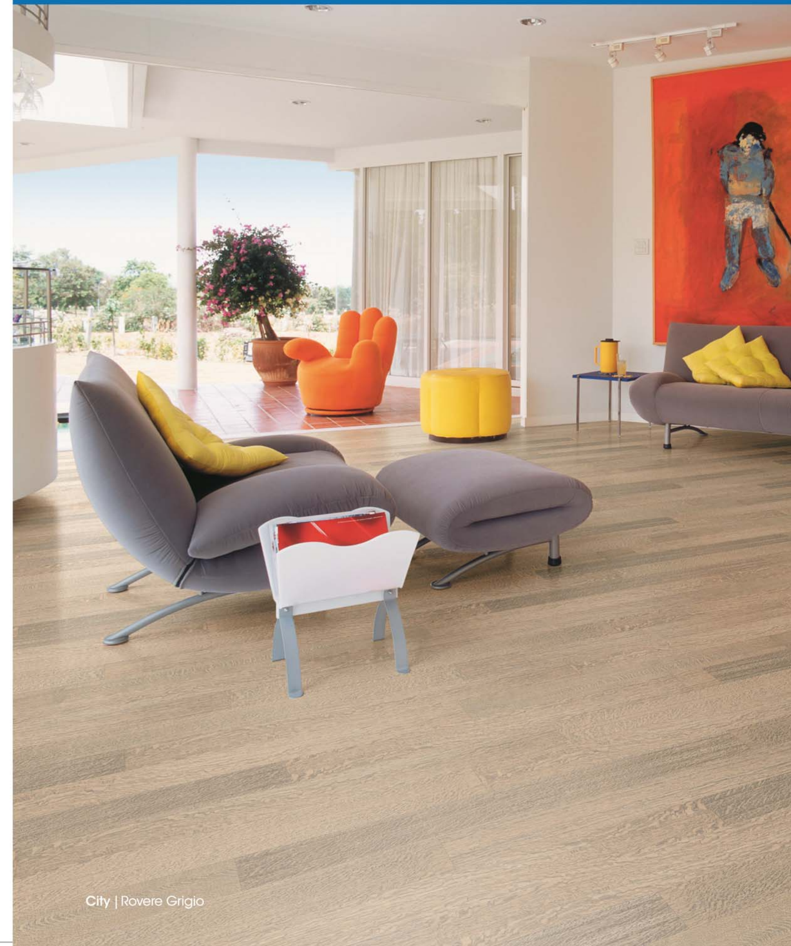
City | Rovere Grigio