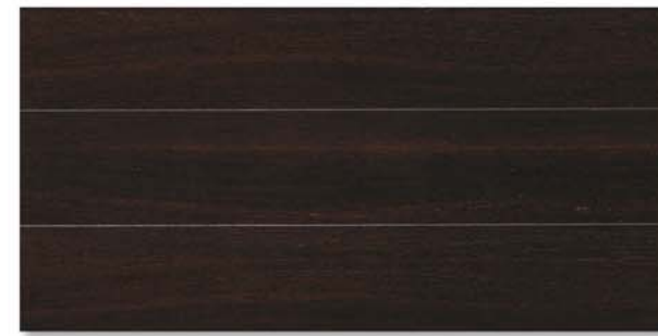
City | Wengé