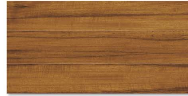
City | Teak